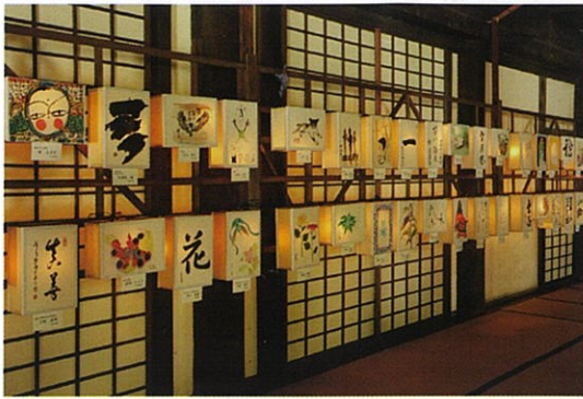
あんどん揮毫献灯風景(曼荼羅堂内)