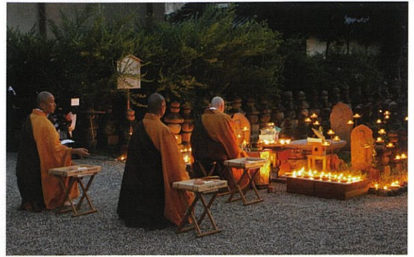
塔婆供養風景(浮図田前)