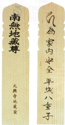
裏 表 塔婆供養