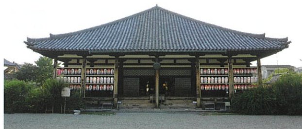
ちょうちん奉納(曼荼羅堂東正面)