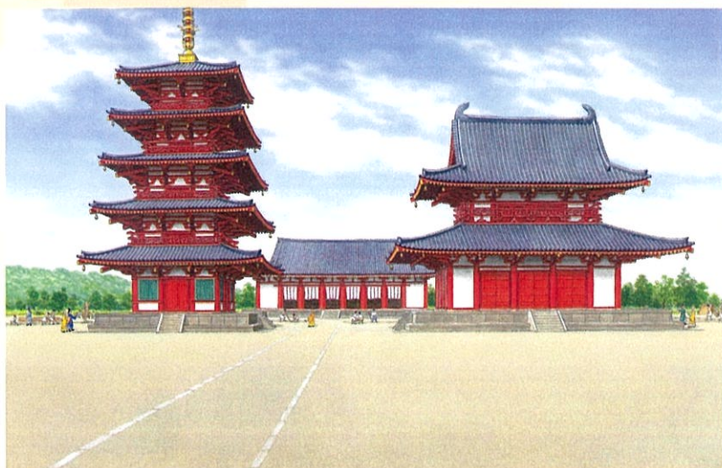
「法隆寺金堂と五重塔」(『週刊日本の世界遺産 10』2012年)