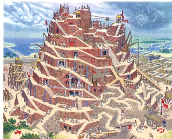
「バベルの塔」(『伝説の迷路』2008年)