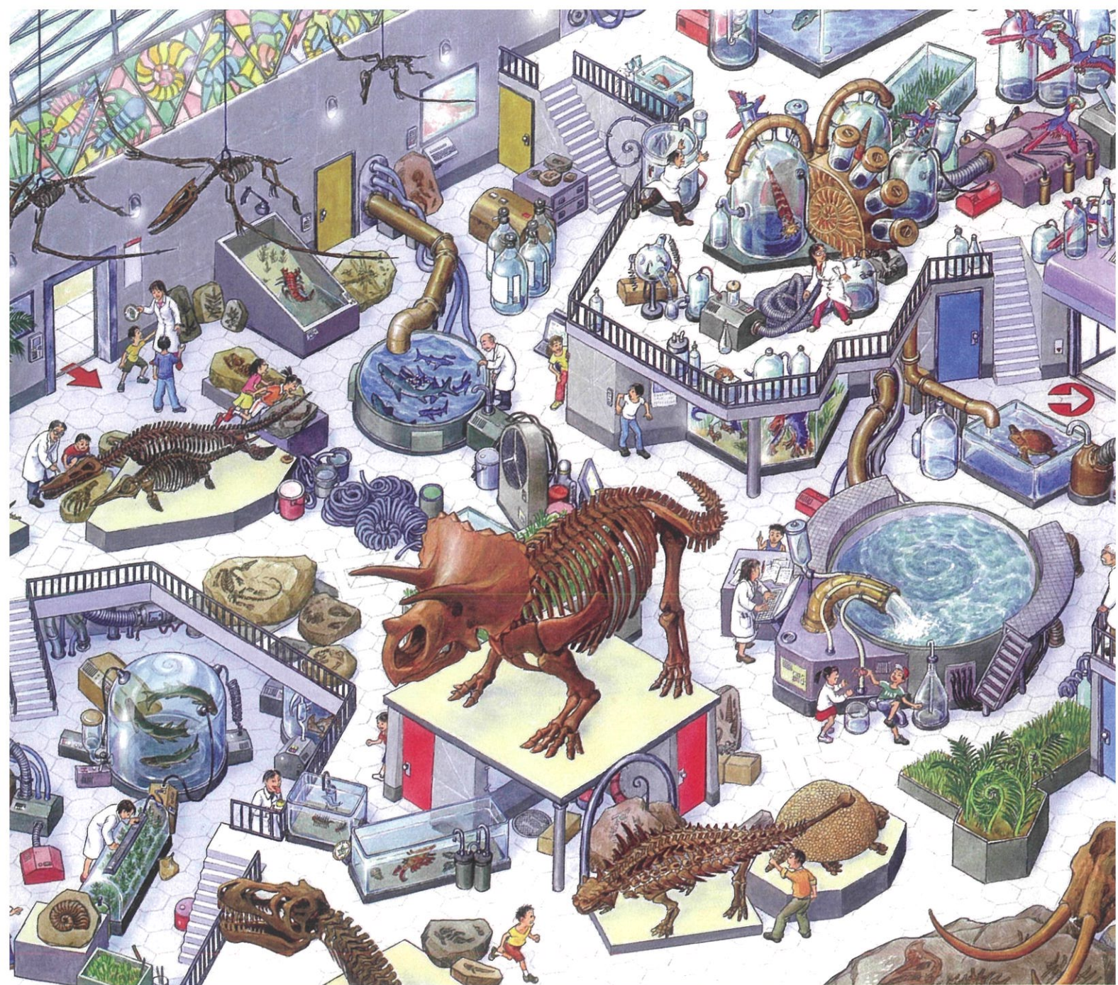
「研究所」(『進化の迷路』2007年)