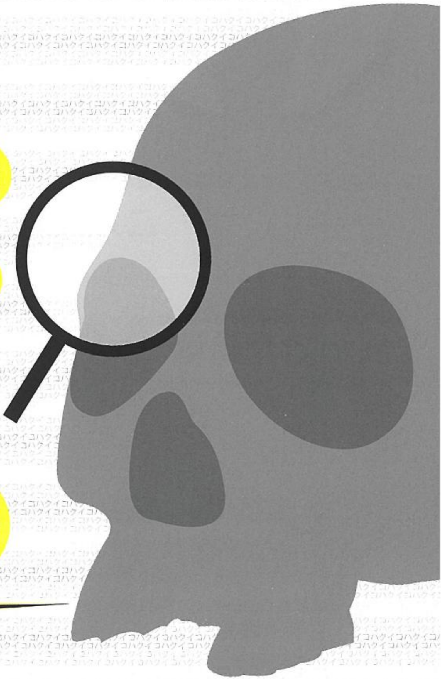
イラスト 長寺遺跡出土 頭骨 (天理市教育委員会 蔵)