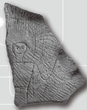
坪井遺跡 人物線刻画土器 (橿原市指定文化財)

高校生が自分たちを、そして絵をデータ化したことで見えてきた 弥生ARTの姿 を堪能してください。