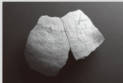
清水風遺跡 人物絵画土器(展示資料はレプリカ) (奈良県立橿原考古学研究所附属博物館蔵)