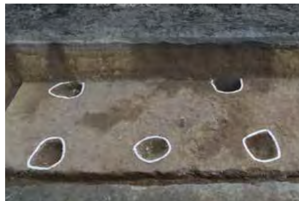
掘立柱建物（西から） 吉備池遺跡第18次調査