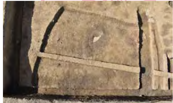
竪穴住居（上が北） 出雲西遺跡第3次調査

今回の速報展では、令和3年度におこなわれた発掘調査の成果を紹介します。令和3年度は10件の調査をおこない、 まきむく 纏向遺跡では古墳の濠の可能性がある遺構を確認しています。また、出雲西遺跡では掘立柱建物とカマドが付属する竪穴住居が見つかり、吉備池遺跡では藤原京四条条間路の道路側溝が見つかるなど、桜井市の歴史を読み解くうえで重要な発見がありました。このように50cm下に広がる桜井市の新たな発見を速報としてみなさまにお届けします。この展示会をきっかけに桜井市の文化遺産に親しんでいただければ幸いです。