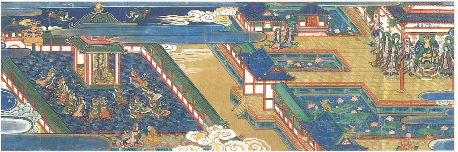
二月堂縁起 上巻 部分 (東大寺)