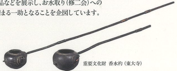
重要文化財 香水杓 (東大寺)

本展は、毎年、東大寺でお水取りがおこなわれるこの時季にあわせて開催する 恒例の企画です。実際に法会で用いられた法具や、歴史と伝統を伝える絵画、古文 書、出土品などを展示し、お水取り(修二会)への 理解が深まる一助となることを企図しています。