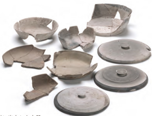
木簡と一緒に出土した土器