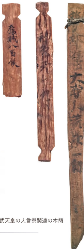
聖武天皇の大嘗祭関連の木簡