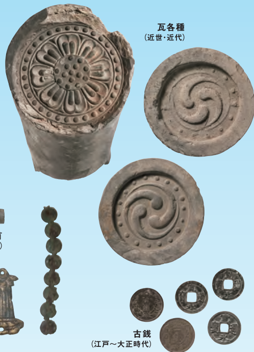
瓦各種 (近世・近代)