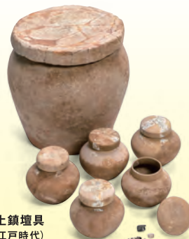
講堂出土土器埴具 (江戸時代)