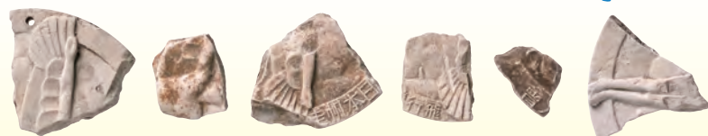
薬師寺境内から発見された赤膚(あかはだ)焼の陶片 (昭和時代)