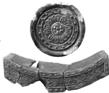
緑釉瓦 平城宮東院庭園ほか 〔奈良文化財研究所蔵〕

会場：当博物館 特別展示室ほか 日時：10月15日(土)・11月5日(土)・11月26日(土) 各回 10:30 ~ 11:00