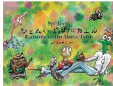
「ジェムくん 故郷にカエル」 原作&イラスト&写真=ポール・スミザー 編集&文=深澤てる 発行所=有限会社ガーデンルーム