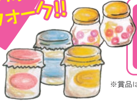
*賞品はイメージです。