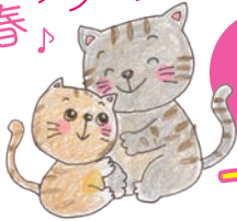
恋する飛鳥ナビゲーター 福まねき猫「リリー&蘭ちゃん」