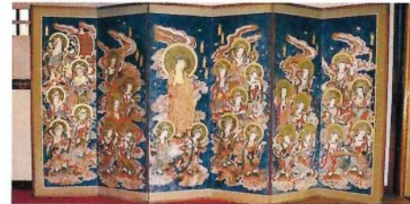
阿彌陀如来二十五菩薩来迎図六曲屏風

西方極楽浄土の主尊である阿彌陀如来は、衆生を救い、そして西方極楽浄土に引導することを誓願としています。ここでは、阿彌陀如来を中心にして、二十五尊の菩薩がそれぞれに楽器を手にして歌舞音曲を奏でながら、共に雲に乗って西方極楽浄土より降り来たるお姿、すなわち来迎の模様を描いた屏風絵であります。 ※要拝観料 TEL.0746-32-4354