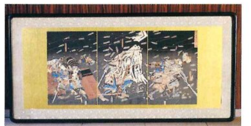
四条畷の合戦の図(歌川国芳・作)

延喜年間に、日蔵道賢上人の創建と伝えられています。後醍醐天皇が勸願寺と定められ、境内の裏には後醍醐天皇の御陵があります。宝物殿には蔵王権現像(重要文化財)や楠木正行が辞世の歌を刻んだ扉などが納められています。 ※要拝観料 TEL.0746-32-3008