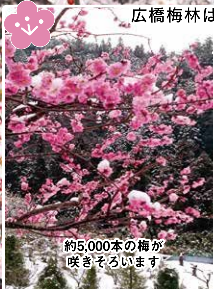
約5,000本の梅が 咲きそろいます