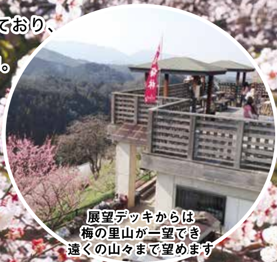
展望デッキからは 梅の里山が一望でき 遠くの山々まで望めます