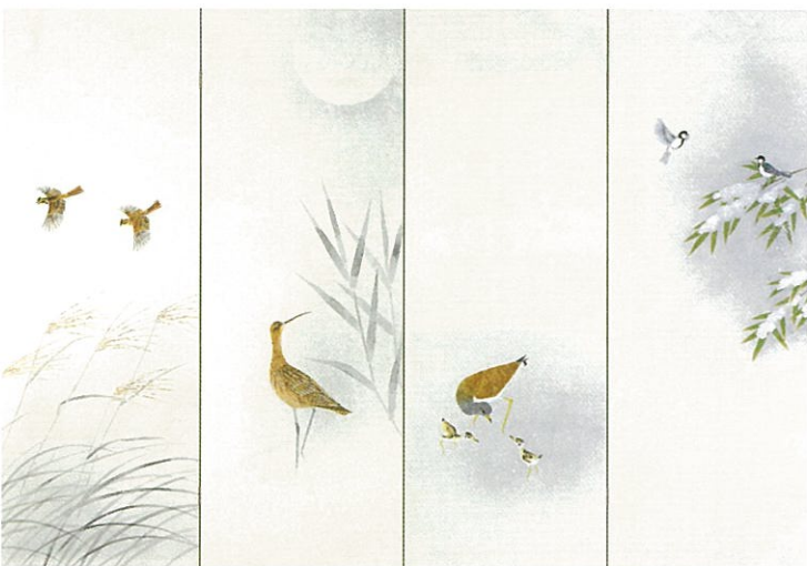
「四季花鳥園」平成13年(2001)

自然から学び教えられ、胸中に生命力あふれる世界を体現させる事で生きものたちの確かな世界を捉える。 上村淳之は日本画の在り方が問われる昨今、遙かなる時代から育まれた日本独自の簡潔の美、装飾の美を追求し日本画のあるべき姿を後世に伝えています。 象徴空間と自然との調和、野生への眼差しと洗練された対話。美を感じられて初めて識る世界をご堪能下さい。