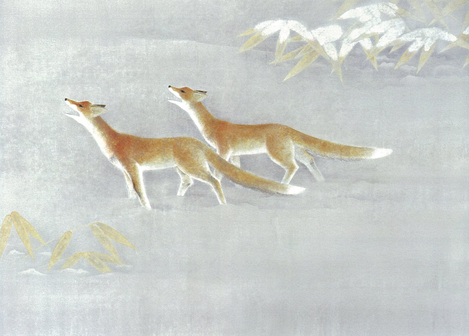
上村淳之「初めての冬」平成5年(1993年)