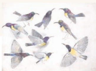
上村松篁「サンバード」素描

松伯美術館は、Googleが提供する GoogleArts & Cultureに 参加しています。当館所蔵作品の高解像度画像や360°のパノラマ 画像「ミュージアムビュー」で館内の様子をご覧いただけます。