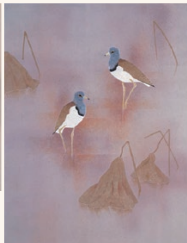
上村淳之「鳥」平成6年(1994)