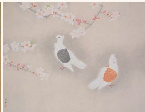
上村松篁「双鳩」昭和60年(1985)