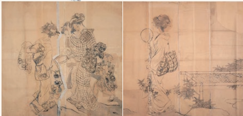
上村松園「月蝕の宵」下絵 大正5年(1916)