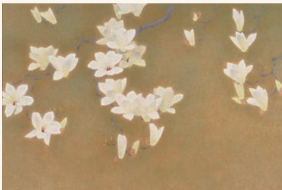
上村松篁「白木蓮」昭和50年(1975)