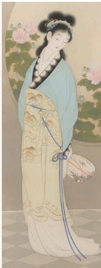
上村松園「唐美人」(部分) 大正13年(1924)