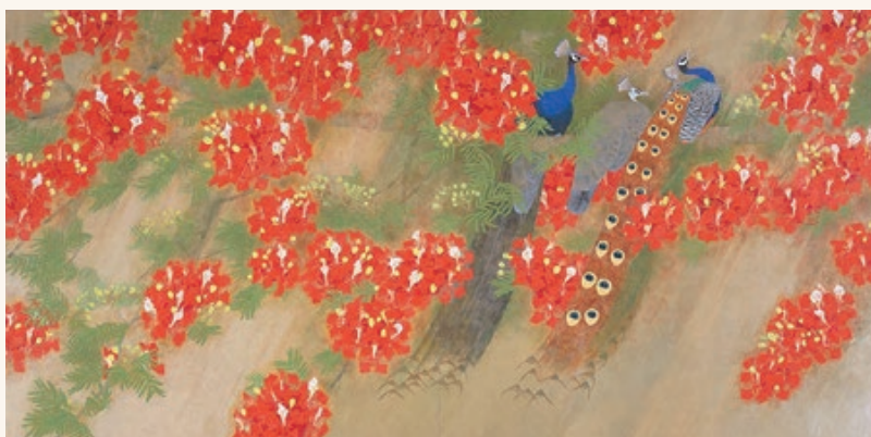
上村松篁「霖雨」昭和47年(1972)