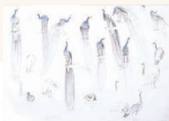
上村松篁「インドクジャク」素描