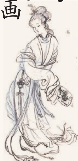
上村松園「唐美人」下絵(部分) 大正7年(1918)頃