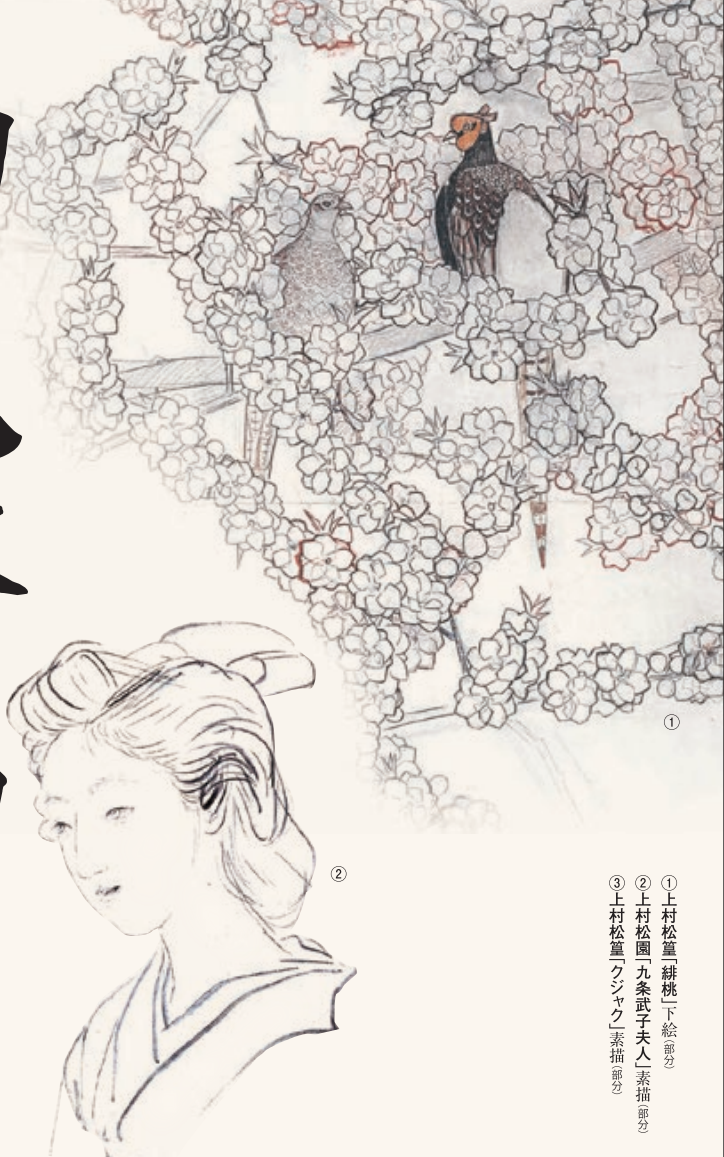
① 上村松篁「緋桃」下絵部分 ② 上村松園「九条武子夫人」素描部分 ③ 上村松篁「ワジャク」素描部分