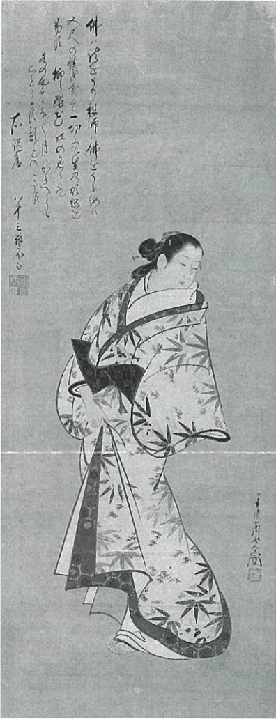
【重要美術品】美人図 宮川長春筆 江戸時代中期

The exhibition comprises Japanese paintings depicting human figures. We recommend giving close attention to the emotions expressed on their faces.