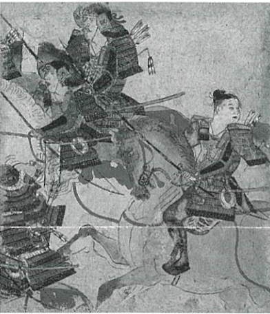
平治物語絵巻断簡 六波羅合戦巻 鎌倉時代