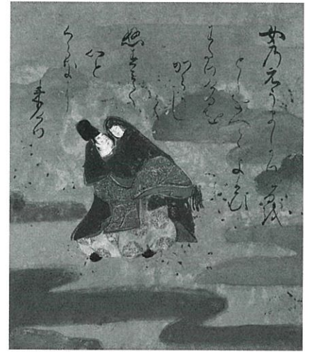
伊勢物語図色紙 六段芥川 伝俵屋宗達筆 江戸時代前期