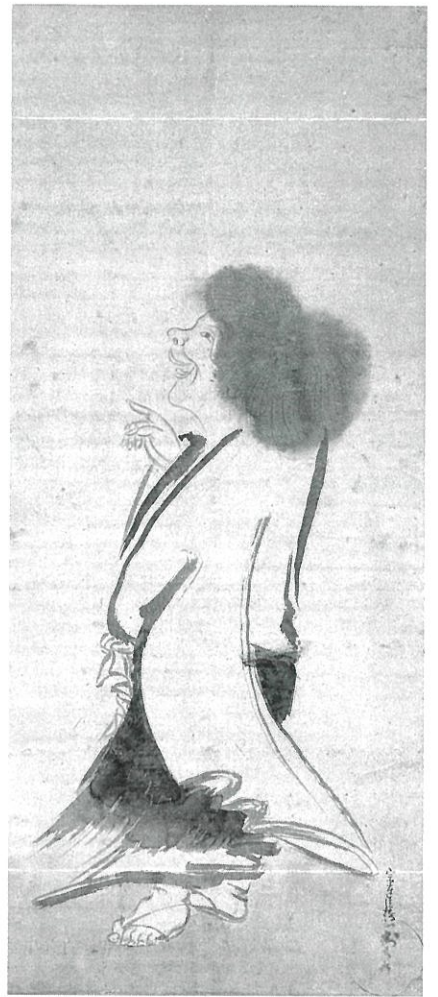
寒山図 俵屋宗達筆 江戸時代前期