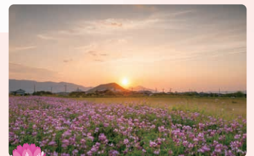
レンゲ 4月中旬～5月上旬

春のイメージといえばレンゲの花畑。飛鳥宮跡辺りから飛鳥寺周辺、石神遺跡周辺など。