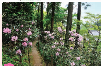
シャクナゲ 4月下旬

村内各所が桜色に染まる、散歩にもってこいの季節。本マップを片手にぜひ巡ってみてください。