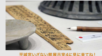
平城宮いざない館展示室4に見に来てね!

平城宮では、政治を行うときのメモ書きや、荷物を保管するときの荷札として木簡が使われていました。文字を消したり再利用するときは、小刀で削って繰り返し使っていました。