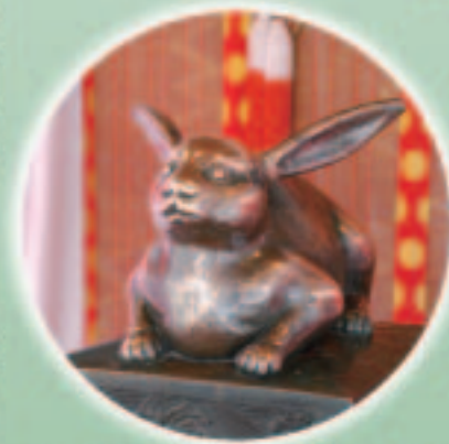
大神神社(なでうさぎ)