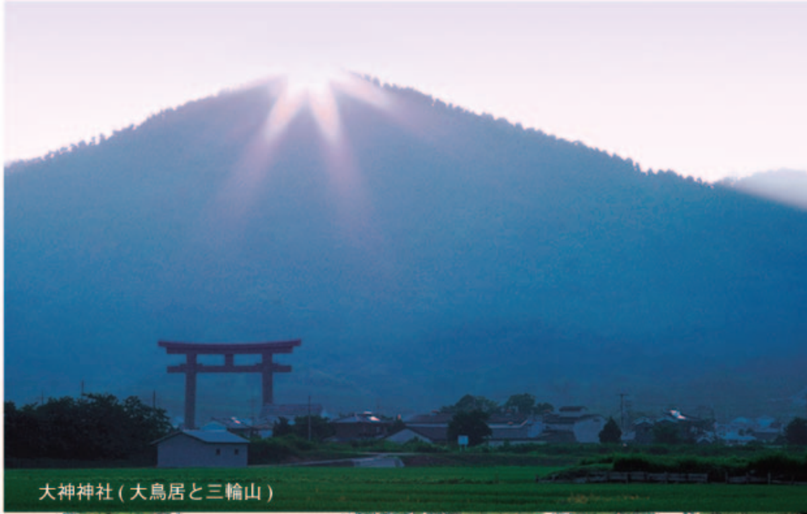
大神神社(大鳥居と三輪山)