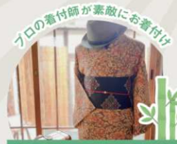
竹林園を着物で散策しよう！ [ワークショップ/予約推奨]