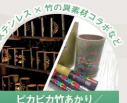
ピカピカ竹あかり/竹にお絵描き体験 [ワークショップ]