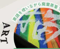
Templish x 茶釜MOJI [ワークショップ]