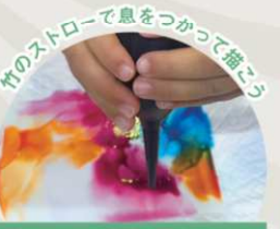
アルコールインクアート体験 [ワークショップ]