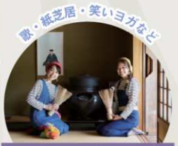
ご当地ユニット「いごままん」すうじい&ジャズミン