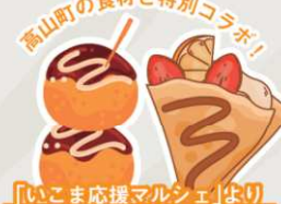
「いごま応援マルシェ」よりヨシヨたご焼き&しおのめキッチンカー