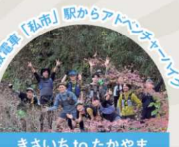
きさいち to たかやまトレイルハイイク [要予約]