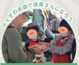
子どもおしごと体験 [ワークショップ/予約推奨]