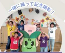
たけまるくんと踊ろう たけまるくんと劇団びまじょんず