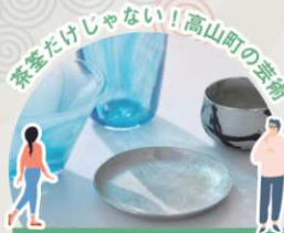
高山町アートミュージアム