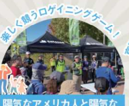
陽気なアメリカ人と陽気なラン&ウォークロゲイング [要予約]