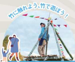
竹ワンダーランド & 竹林ピック