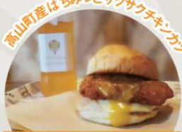
ミツバチチキンバーガー