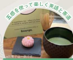
フォニックス英語で茶道体験！ [ワークショップ/予約推奨]