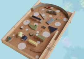
木のピンボールづくり