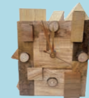
木の置き時計づくり

8月19日(土)・8月20日(日) 10時～12時(午前部) 13時～15時(午後部) 各先着10名(税込)1,000円 要予約(各回1週間前に締切 空きがあれば当日可)