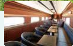
優雅に飲食を楽しむラウンジ車両