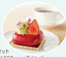
季節のオリジナルケーキセット