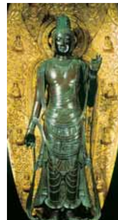
薬師寺東院堂・聖観世音菩薩立像 国宝

薬師寺は白鳳時代(七世紀末)に天武天皇が皇后(後の持統天皇)の病氣回復を願って藤原京(今の橿原市)に建立を發願。平城遷都の折にこの地に移されました。凍れる音楽と評された白鳳様式の建築・東塔 国宝(現在解体修理中)や金堂(ご本尊・薬師三尊像)東院堂の聖観世音菩薩立像、ともに国宝 など、白鳳仏の傑作といわれる仏さまでも知られています。