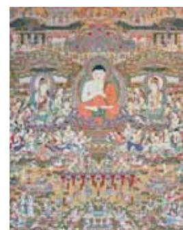
奈良時代の綴織當麻曼陀羅図 国宝(非公開)の写本 色鮮やかな平成本綴織當麻曼陀羅

奈良時代、藤原豊成の娘・中将姫が西方極楽浄土の世界を運糸を染めて織り上げたといわれる綴織當麻曼陀羅図 国宝(非公開)で知られる當麻寺。奥院は京都知恩院の奥之院として建立された當麻寺の塔頭の1つで知恩院から移された法然上人坐像(重文)が本尊。美しい浄土式庭園でも知られています。【奈良つまし冬めぐり】では、平成本綴織當麻曼陀羅の絵説きの後、當麻寺境内の三堂を僧侶の案内で巡ります。