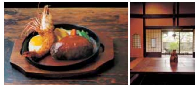
ボリューム満点のハンバーグとぷりぷりの天然えびを使った有頭エビフライの黄金コンビ、エビフライ&ハンバーグセット 1,728円

0742-24-5187 奈良市公納堂町14 11:30AM - 3:00PM(LO) / 6:00PM - 9:00PM(LO) 売り切れ次第終了 水曜日