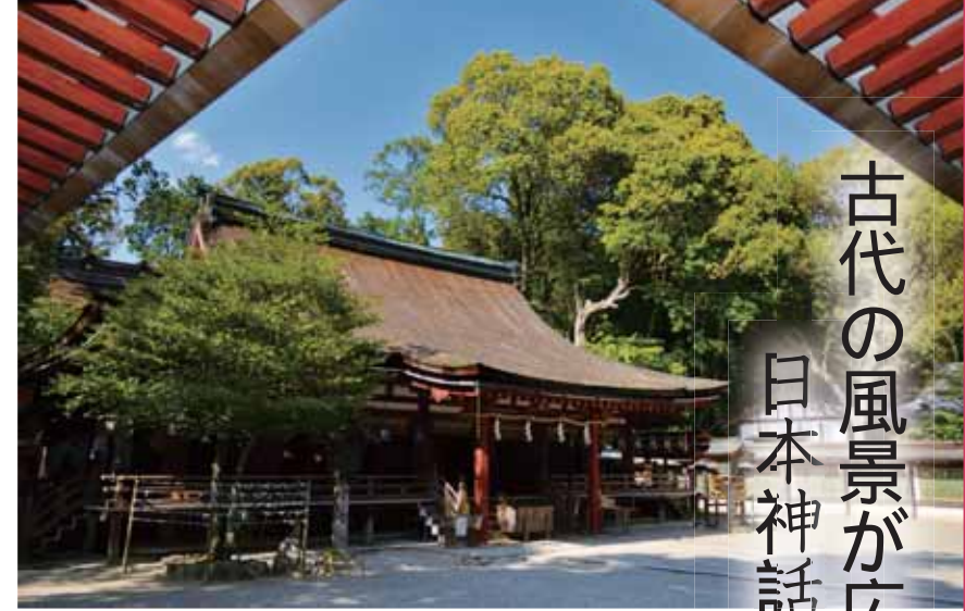
平安時代に白河天皇が宮中の建物を寄進したと伝わる拝殿 国宝