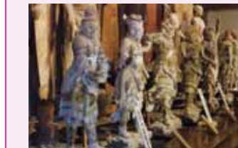
室生寺金堂・十二神将立像(重文)

十二神将といえは忿怒の形相が一般的ですが、室生寺金堂の十二神将はとても親しみやすく、頭上の十二の方位を象徴する干支には愛嬌も。鎌倉時代中期を代表する自由闊達な表現が魅力です。十二神将とは薬師如来を護衛する十二の武将のこと。金堂本尊は釈迦如来立像として伝わりますが、本来は薬師如来として造像されたとされています。