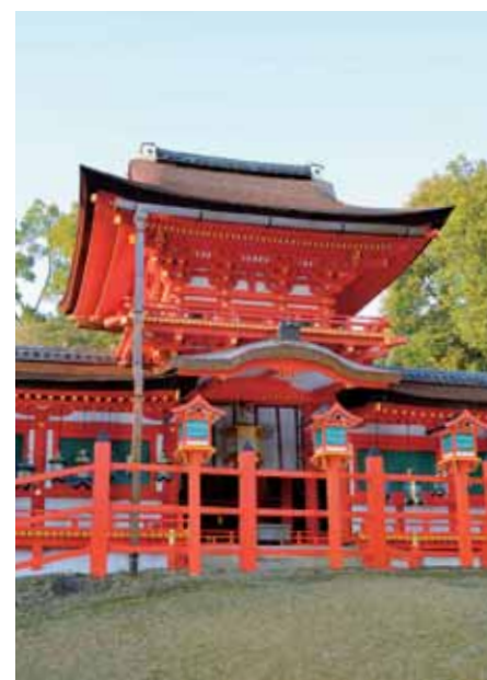
春日大社中門 JR・近鉄奈良駅 春日大社本殿行バス終点下車すぐ または市内循環バス「春日大社表参道」下車徒歩約10分

奈良時代、古くから神聖な場所とされた御蓋山の麓に、平城京を守り国家の繁栄を願って社殿が造営された春日大社。2015年から2016年は20年に一度、御本殿の造り替えや修繕を行う御造替の年にあたり、2016年11月、真新しくなった御本殿に御祭神がお遷りになる正遷宮が盛大に行われました。