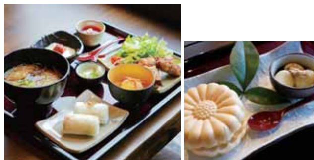
国産鶏を使った竜田揚げに吉野産の原木しいたけの素揚げ、季節の焼き込みご飯などがついた斑鳩名物・竜田揚げランチ1,500円。スイーツは柿と白あんの最中&豆腐白玉だんご700円。土日は予約がおすすめです。

0745-75-7717 生駒郡斑鳩町法隆寺1-9-33 11:00AM~4:30PM(LO) ランチは売り切れ次第終了 月曜日