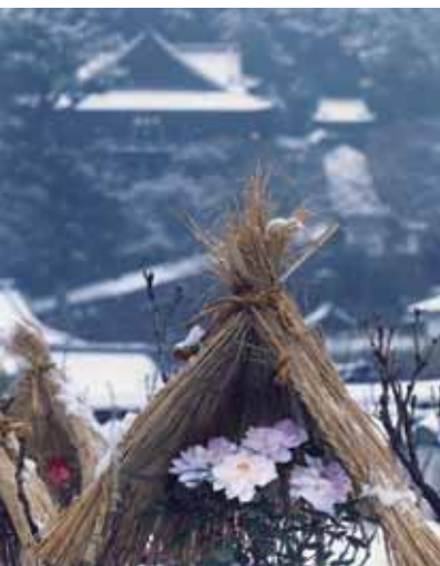
「花の御寺」で知られる長谷寺の冬牡丹と本堂 国宝 (冬季には梅や椿・山茶花なども楽しめる)

戦国時代に建てられた稱念寺の寺内町として発展した今井町。江戸時代には、「大和の金は今井に七分」(大和国の経済のほとんどが今井に集まる)といわれたほど商業の町として栄えました。江戸時代の町家の佇まいは大切に保存され、今も暮らしが息づいています。(近鉄八木西口駅下車徒歩約5分またはJR畝傍駅下車徒歩約8分)