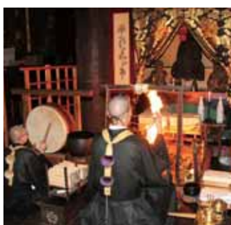
毎日行われている金峯山寺の長日護摩祈禱

古くから神山として信仰されてきた金峯山と室生山。吉野山の金峯山寺は厳しい奥駈修行で知られる修験道の根本道場。室生寺は女人高野の名で親しまれる女人救済のお寺です。力強い木造建築と御仏が魅力の金峯山寺と優しく女性的な室生寺それぞれの「祈り」の世界観を味わってみましょう。