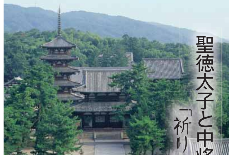
世界最古の木造建築で知られる法隆寺・西院伽藍 (左から五重塔、中門、金堂 すべて国宝)

日本に仏教を広めた聖徳太子ゆかりの地・斑鳩の里と霊山・信貴山。西方極楽浄土の世界に憧れた中将姫ゆかりの地・當麻の里。連綿と受け継がれる「祈り」の聖地へ、伝説を訪ねる旅に出かけましょう。