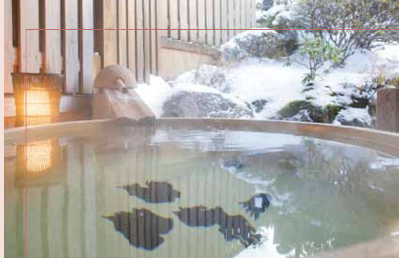
洞川温泉(旅館 角甚)