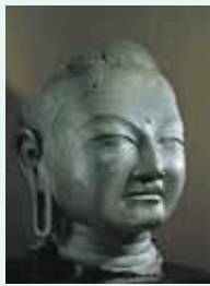
興福寺東金堂本尊・盧舎那仏坐像 国宝