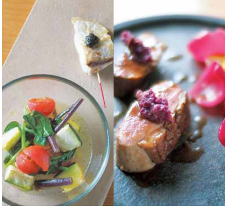
写真は昼のコース3,240円より一例として。夜のコースは5,400円。メニューは月替わり。

メインに、2皿の前菜、スープ、サラダ、季節のデザートプレートなど9品が付いたirisコース1,940円 写真はイメージです