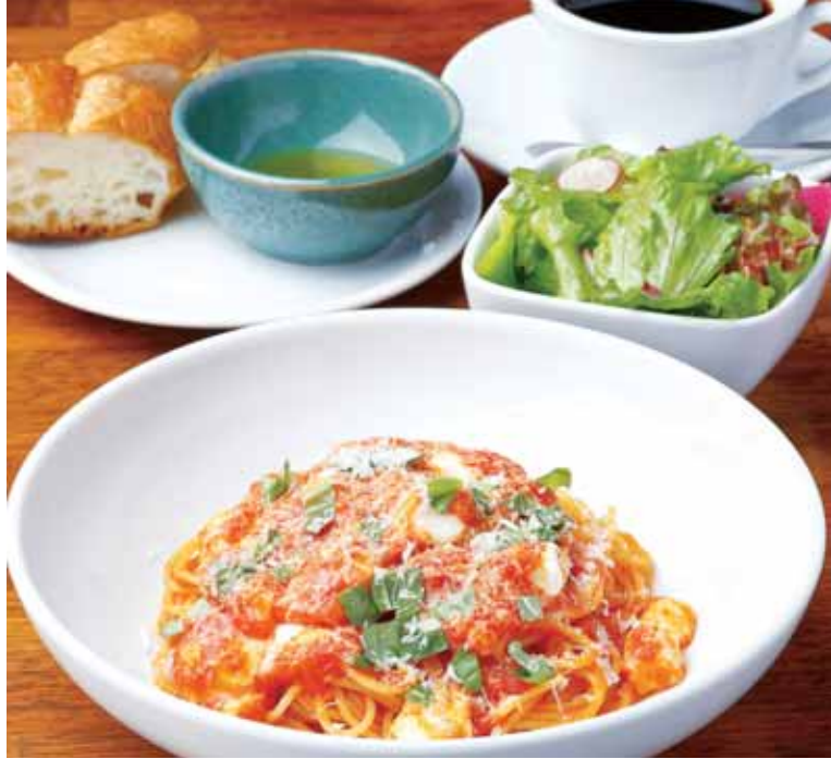
サラダ、パン、日替わりパスタにコーヒーor紅茶が付いたカフェランチ1,296円。デザートも本格派で季節替わりの特製スイーツやプリンも人気。