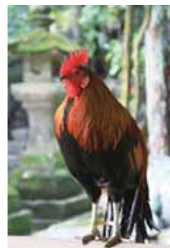
石上神宮境内の御神鶏(ごしんけい) (晩に時を告げることから鶏は神の使いとされてきた)

石上神宮は日本神話に登場する神剣に宿る御霊を主祭神として祀る日本最古の神社の一つ。橿原の地で即位した第一代神武天皇が宮中に祀り、第十代崇神天皇の時代に古代豪族・物部氏の祖が現在の地に御霊を遷したと伝えられています。拝殿は平安時代、白河天皇が宮中の神嘉殿を寄進された建物。その後方に主祭神が鎮まる「禁足地」があ