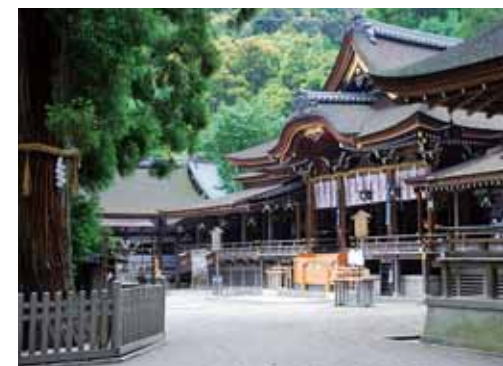
三輪山を御神体とする大神神社・拝殿と巳(み)の杉材(左) (神の化身である白蛇が纏む杉材に好物の卵を供えたと願い事が叶うとも)

大神神社に伝わる御神像、三輪山麓の古代祭祀遺跡で発見された考古遺物などを公開する宝物収蔵庫、摂社・狹井神社、国の名勝・大和三山の眺望が素晴らしい「大和の杜」展望台へ神職が案内します。