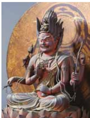
西大寺愛染堂秘仏本尊・愛染明王坐像(重文)

西大寺の大茶盛で使われている大茶碗には奈良の伝統工芸・赤膚焼も。桃山時代、郡山藩(今の和歌山)の城主・豊臣秀長によって窯が開かれたのがはじまりとも。乳白色のやさしい風合いにシンプルな図案と色彩の奈良絵が人気です。湯飲みやマグカップの絵付け体験ができる窯元も。仕上げて自宅に送ってもらえるので、ぜひ記念のお土産に。