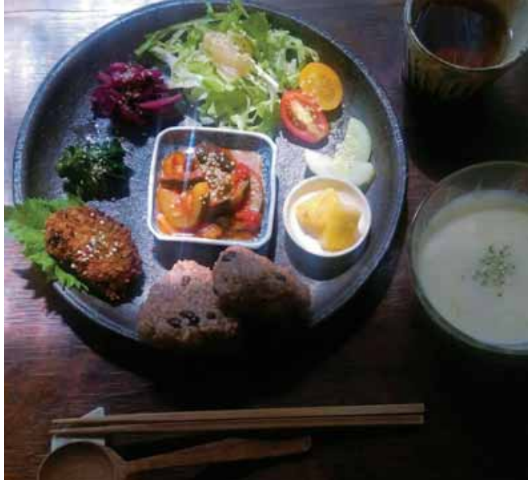
店主自ら作る週替わりのワンプレートごはん、恵みの麻ベジごはんは700円。玄米ごはんも丁寧なお野菜のおかずにも真心を感じる。事前予約がベター。