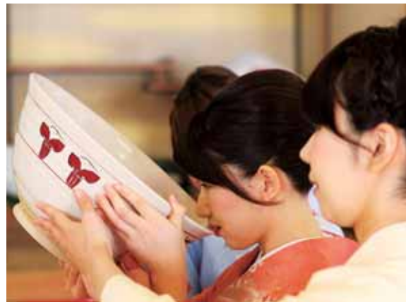
西大寺 直径40cmもある大茶碗を回し飲む伝統行事・大茶盛