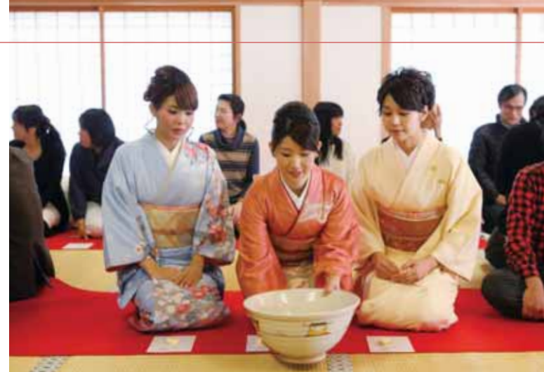
西大寺 大茶碗で点てた茶を回し飲む伝統行事・大茶盛