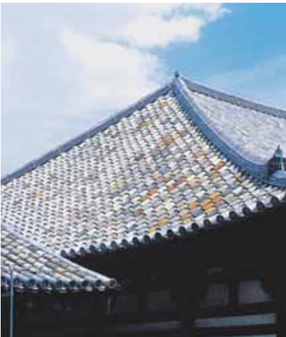
元興寺極楽堂西側屋根の古代瓦(茶色の瓦が日本最古の屋根瓦)

ご本尊は元興寺で学んだ奈良時代の学僧・智光が夢に見た極楽浄土を描かせたと伝わる智光曼荼羅。安置されていた僧坊は極楽坊として