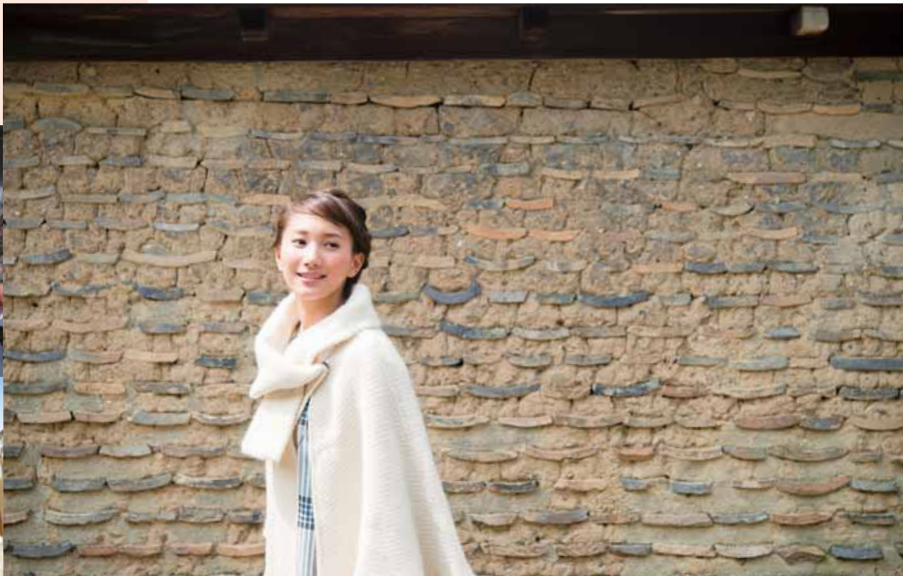
東大寺二月堂・参道の土塼