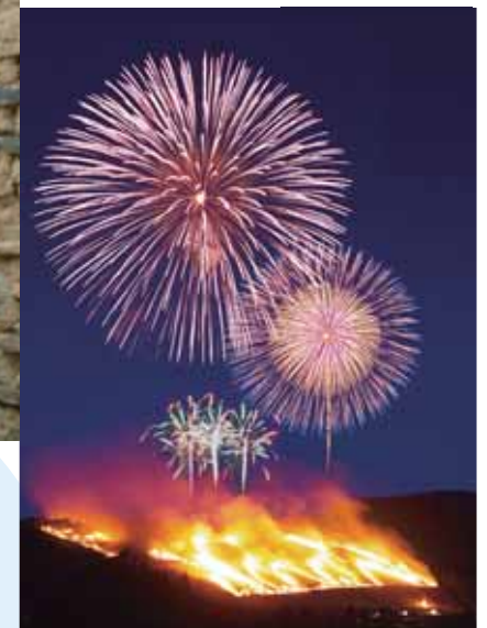
冬の奈良の夜空を彩る伝統行事・奈良若草山焼き