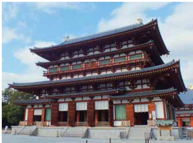
ご本尊・薬師三尊像 国宝 を祀る白鳳様式が美しい薬師寺金堂