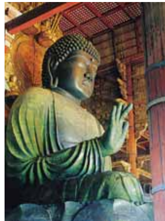
東大寺金堂本尊・盧舎那仏坐像 国宝

鎌倉時代には重源上人、江戸時代には公慶上人らの働きで見事に復興。聖武天皇の平和への願いが今に受け継がれているのです。