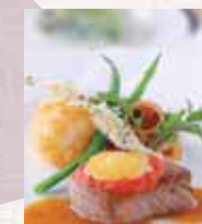
奈良ホテルランチコース(イメージ)

「鹿寄せ・観賞・春日大社参拝・奈良ホテル見学・ならまち散策」 (昼食は当ツアー限定メニュー)