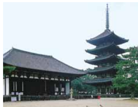
焼失と再建を繰り返した興福寺伽藍 東金堂(左)と五重塔ととも国宝

その後、五重塔や東金堂など堂塔は何度も被災しましたが、その都度、藤原氏や朝廷の力で復興を遂げ、阿修羅像をはじめとする奈良時代の仏像や鎌倉時代復興期の名彫刻な