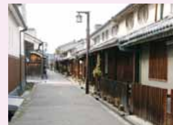
橿原市今井町の町並み

戦国時代に建てられた稱念寺の寺内町として発展した今井町。江戸時代には、「大和の金は今井に七分」(大和国の経済のほとんどが今井に集まる)といわれたほど商業の町として栄えました。江戸時代の町家の佇まいは大切に保存され、今も暮らしが息づいています。(近鉄八木西口駅下車徒歩約5分またはJR畝傍駅下車徒歩約8分)