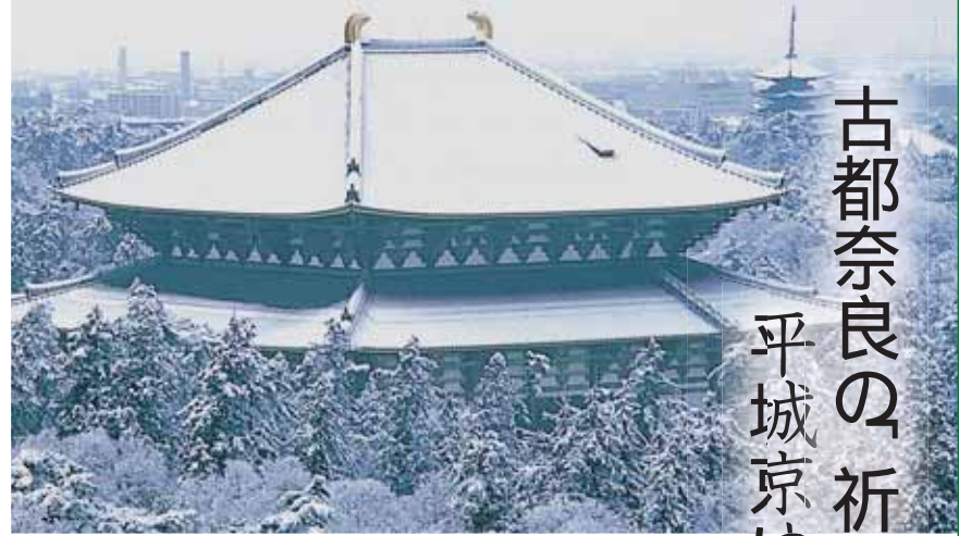
東大寺金堂(大仏殿) 国宝 後ろに興福寺五重塔 国宝