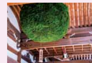
酒造り発祥の地・ 大神神社の杉玉

「味酒三輪の」と万葉集に詠まれた味酒は三輪の枕詞。ミワは古語でお酒のこと。三輪山を御神体とする大神神社は酒造り発祥の地。酒の神としても信仰を集めてきました。毎年、十一月の酒まつりには全国から造り酒屋さんが参拝に訪れ、三輪の神籬(霊木)とされる杉材で作られた杉玉を拝受し、新酒のしるしとしてお店の軒先に吊されます。