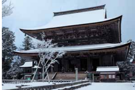
日本最大の秘仏本尊・金剛蔵王権現三休(重文)を祀る金峯山寺本堂・蔵王堂 国宝

吉野山から熊野(和歌山県)へと続く大峯奥駈道とその一帯は、太古から金峯山と呼ばれた聖域。飛鳥時代後期、この地で修行を積んだ役小角(役行者)が日本独自の修験道を開きました。険しい山々の尾根道を歩く「奥駈修行」には、毎年たくさんのお参り者が訪れます。 金峯山寺は修験道の根本道場。檜皮葺の大屋根では日本最大級とい