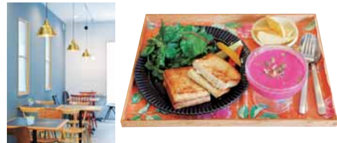
愛らしいマトリョーシカなど、ロシアや東欧の雑貨をはじめ、作家もの雑貨などを販売するコーナーも。

0742-87-1310 奈良市西新屋町40-1 11:00AM - 6:30PM(LO) 月・火曜休