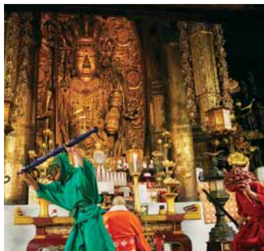
2月14日に行われる行事・長谷寺のただおし(鬼追い式)後ろにおられるのが 本尊・十一面観世音菩薩立像(重文)

また、奈良時代に始まる西国三十三所観音霊場巡りの第八番札所として信仰を集めるとともに、四季折々の花々・紅葉が美しい「花の御寺」としても知られ、毎年たくさんの人々が参拝に訪れます。【奈良つまし冬めぐり】では、僧侶の案内で、一般には立ち入ることができない本堂 国宝 に入り、ご本尊・十一面観世音菩薩立像(重文)を特別に参拝、御足に直接触れ、ご本尊とご縁を結びます。