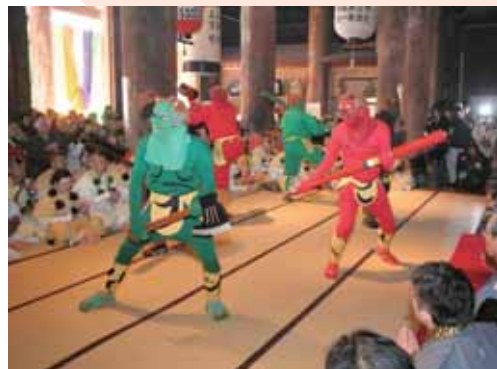
金峯山寺蔵王堂の節分会 鬼火の祭典

http://yamatoji.nara-kankou.or.jp/005onsen-yado/