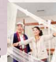
三輪そうめん手延べ体験(イメージ)

室生寺・長谷寺拝観後、三輪そうめんの老舗で手延べ体験(試食・生薬類のお持ち帰りも)