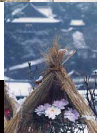
花の御寺で知られる 長谷寺の冬牡丹