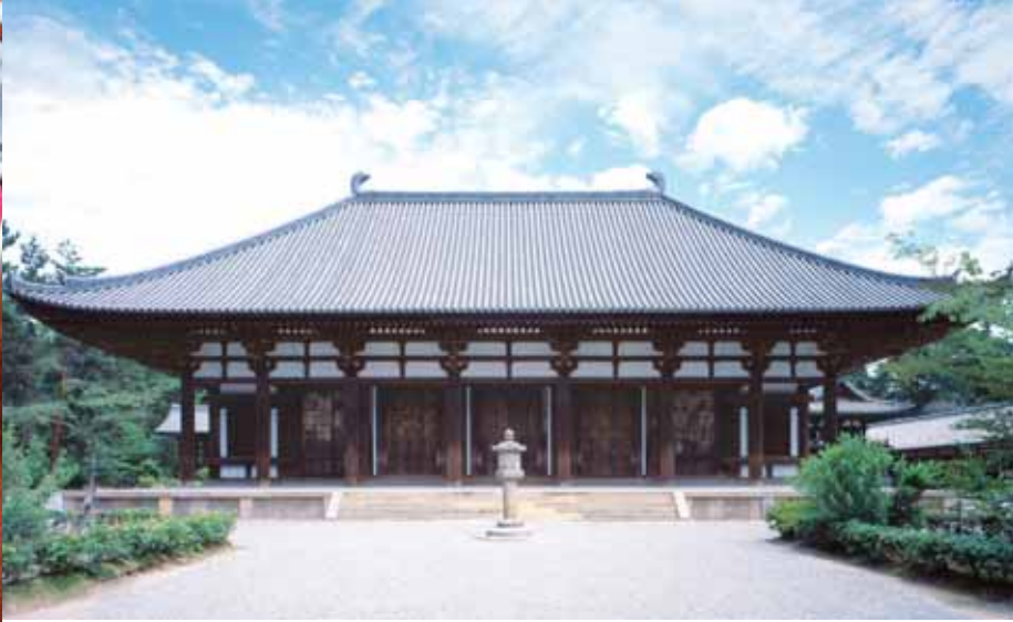
井上靖の小説『天平の甕(いらか)』で知られる唐招提寺金堂 国宝 大屋根の上の左右にあるのが火除けのまじないともいわれる鴉尾(しび)

奈良時代に来日した中国・唐の高僧・鑑真和尚の戒律道場が唐招提寺のはじまり。鑑真を慕う皇族や貴族たちの寄進により伽藍が整えられました。井上靖の小説『天平の甕』で有名な金堂や平城京の東朝集殿を移築したと伝わる講堂、現存日本最古の校倉造・経蔵、すべて国宝