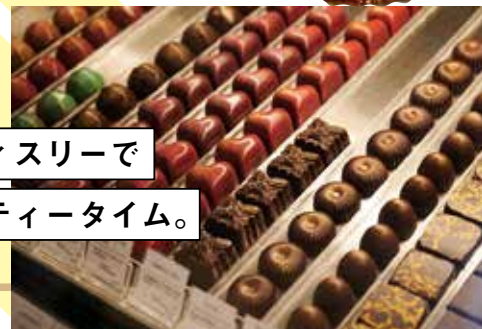
新斬なフィリングがそろうショコラは1粒から