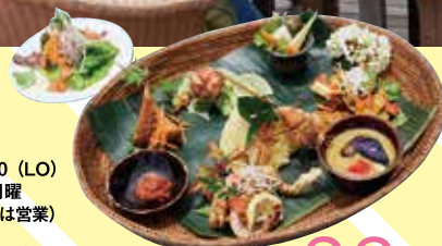
7種類のエスニック惣菜と串焼き、ターメリックライスが味わえるスペシャルランチプレート「ナシチャンプル」1,540円

大和地鶏や地場産野菜とインドネシアのスパイスを融合し、バリ出身のシェフが本場の味に。スイーツやコーヒーの焙煎まで自家製にこだわる。