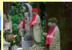
本堂の背後には弘法大師も修業したと伝わる「般若窟」がそびえる