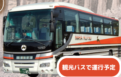
観光バスで運行予定