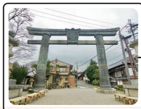
写真は2月頃に撮影したものです。当日と写真の風景は実際と異なります。

銅の鳥居（かねのとりの）の本来の名称は「発心門（ほっしんもん）」といい、菩提心を発するところとされ、初めて大峯修行を志す行者の行場の一つです。創立年代は不明ですが、聖武天皇が奈良の大仏の余銅で作ったという伝説があります。