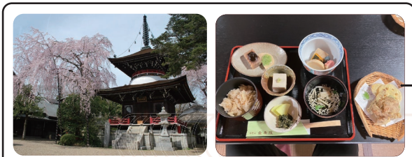
写真は4月頃に撮影したものです。当日と写真の風景は実際と異なります。