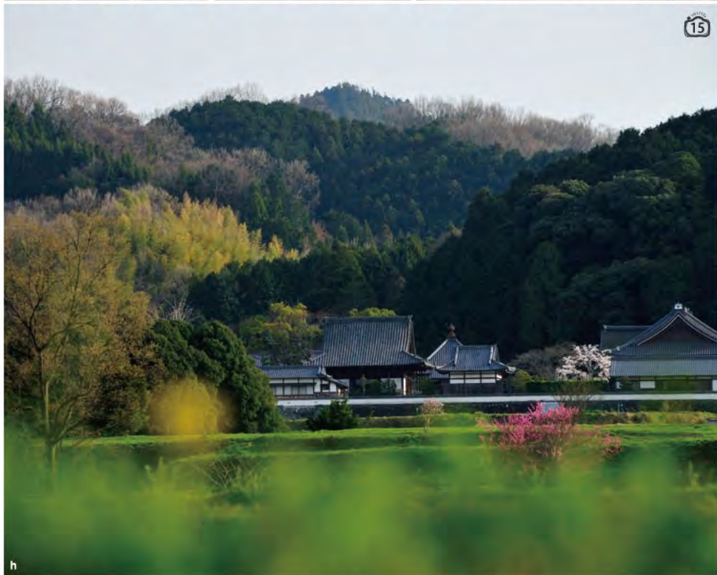
a. 細川谷の上流、上(かむら)からの眺め。8月下旬撮影。 b. 島庄の棚田。3月下旬には、菜の花が眩しく咲き誇ります。 c. かんびょう干しは、今では珍しくなってしまった夏の風物詩。 d. 福測の飛鳥川上坐宇須多岐比売命神社。長い石段が深い森の中に続きます。 e. 10月下旬の籾殻焼き。 f. 檜隈寺跡の森が見える栗原の夕暮れ。 g. 急な斜面に作られた細川の集落。懐かしい風景は、息を切らしてでも登ってみる価値があります。 h. 飛鳥京跡苑池辺りから橋寺を遠望。