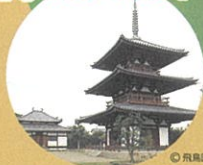
法起寺 (世界文化遺産)