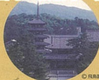
法隆寺 (世界文化遺産)