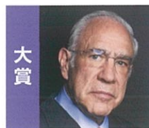
大賞 アンヘル・グリア Angel Gurria (前OECD事務総長)