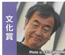
文化賞 隈 研吾 KUMA Kengo (建築家・東京大学特別教授・名誉教授)