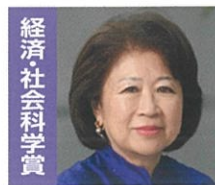
経済社会科学賞 マリ・エルカ・パンゲストゥ Mari Elka Pangestu (世界銀行専務理事)