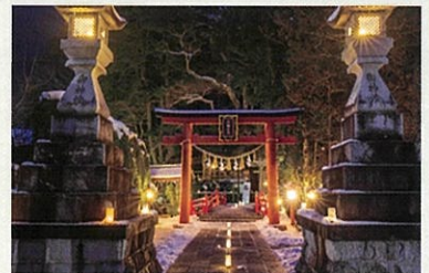
【天河大辨財天社お問い合わせ】