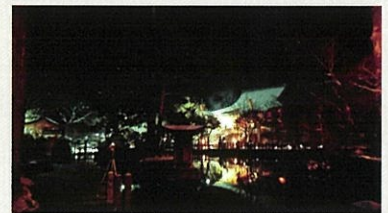
【龍泉寺お問い合わせ】