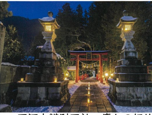
天河大辨財天社 癒しの灯り