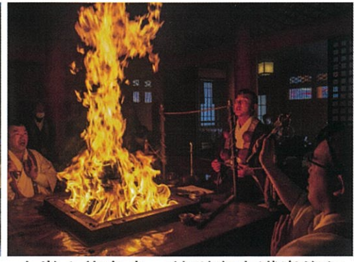
大峯山龍泉寺 特別寒中護摩修行