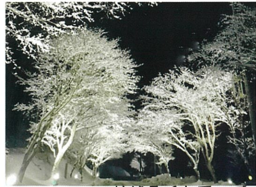
蛇峠ライトアップ