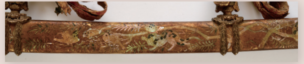
③ 黄金の金具と猫螺鈿の平安工芸の至宝