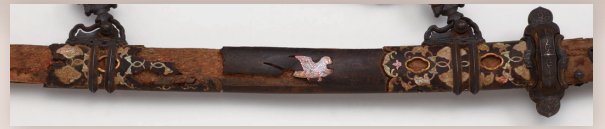
① 撰関家に伝わった鸚鵡螺鈿の飾劔