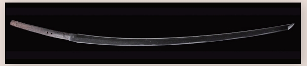
⑥ 近年の修理で判明した日本刀成立期の秘刀