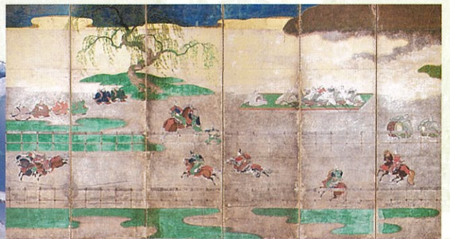
奈良県指定文化財 競馬図屏風 左隻 室町時代 後期展示