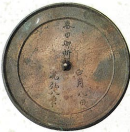
重要文化財 古神宝銅鏡類 素文鏡 平安時代 寛弘8年(1011)