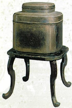
日本最古の化粧箱 国宝 本宮御料古神宝類 黒漆平文唐櫛笥 平安時代 前期展示