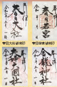
写真: 夫婦大国社御朱印 金龍神社御朱印

【開催日】令和6年10月7日(月)、20日(日)、30日(水)、11月5日(火)、17日(日)、28日(月)、令和7年1月16日(木)、22日(水)、30日(木)、2月7日(金)、16日(日)、24日(月)、3月3日(月)、21日(金)、28日(金) 【開始時刻】14:30(1日1回実施) 【所要時間】約120分 【順路】二之鳥居・春日若宮参拝・夫婦大国社参拝・金龍神社参拝・南門・東回廊・中門(御本殿)・南門 【参加費】5,000円/名 小学生以上同一料金 ※4社御朱印入り朱印帳授与 【最少催行人員】5名