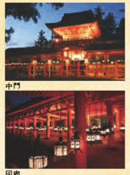
写真: 中門 回廊

【開催日】令和7年2月2日(日) 【開始時刻】19:30(1日1回実施) 【順路】二之鳥居・春日若宮・南門・東回廊・中門(御本殿)・南門 【所要時間】約70分 【最少催行人員】5名 【参加費】2,500円/名 小学生以上同一料金 ※福豆付