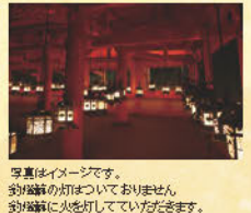
写真: イメージです。鈿燈籠の灯はついておりません。鈿燈籠に火を灯していただきます。

【開催日】令和7年1月14日(火)、18日(土)、24日(金)、30日(木) 2月5日(水)、15日(土)、22日(土)、27日(水) 3月2日(日)、16日(日)、19日(水)、30日(日) 【開始時刻】1月17:00、2月17:30、3月18:00(各日1日1回実施) 【順路】二之鳥居・春日若宮参拝・南門・回廊の鈿燈籠に献灯・中門(御本殿)・南門 【最少催行人員】10名 【参加費】2,500円/名 小学生以上同一料金 【所要時間】約70分