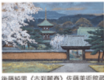
後藤純男「古刹麗春」佐藤美術館蔵