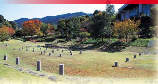
季節の花々を 楽しめる万葉庭園