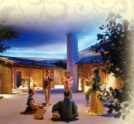
万葉の世界を 体感できる一般展示室