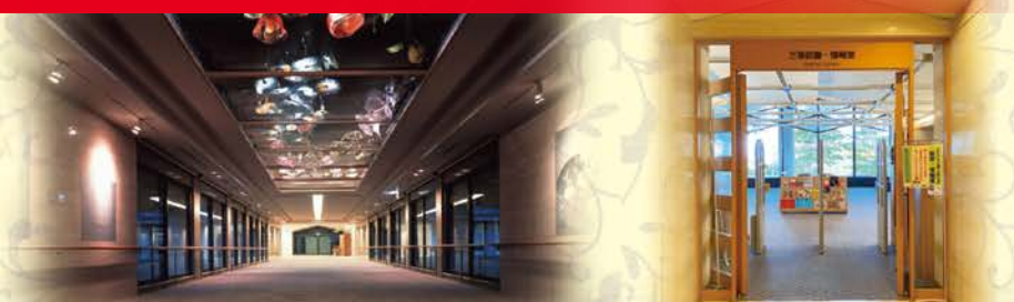
万葉集に関連する 図書・データベースを 自由に閲覧できる万葉図書・情報室