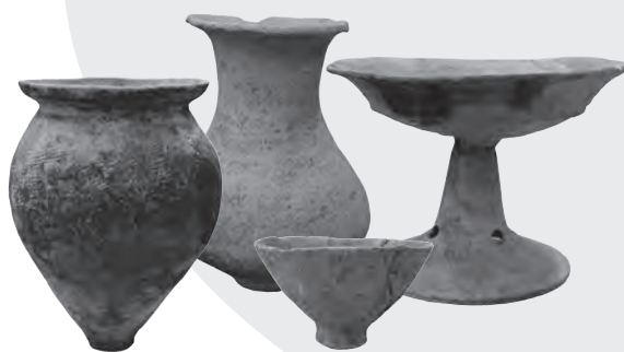
市内遺跡出土の弥生土器