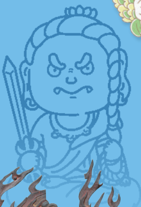
重要文化財 不動明王坐像 鎌倉時代(13世紀) 快慶作 京都・正寿院