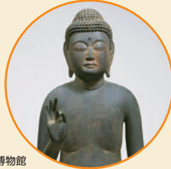
阿弥陀如来立像（裸形） 鎌倉時代（13世紀） 奈良国立博物館