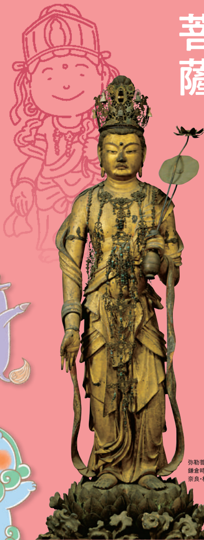
弥勒菩薩立像 鎌倉時代(13世紀) 奈良・林小路町自治会