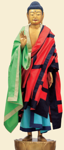
阿弥陀如来立像（裸形）の復元模造（レプリカ）