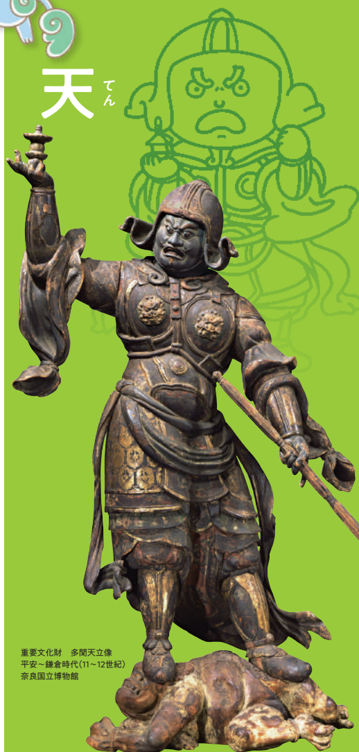
重要文化財 多聞天立像 平安~鎌倉時代(11~12世紀) 奈良国立博物館

Exploring Art: Discover the Buddhist Pantheon