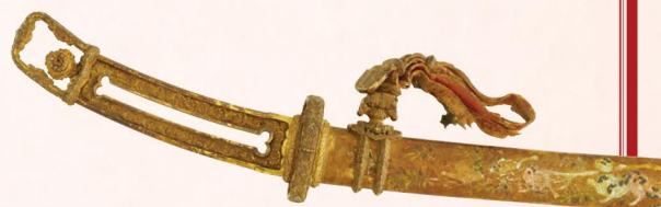
平安時代・12世紀 奈良・春日大社 展示期間：4月19日～5月18日