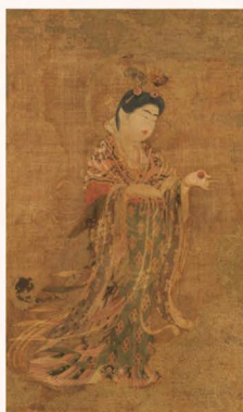
奈良時代・8世紀 奈良・薬師寺 展示期間:4月19日~5月6日