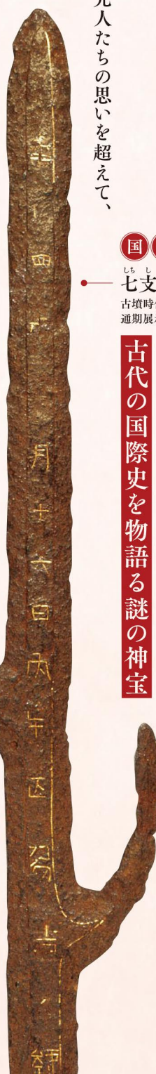
国宝 七支刀 古墳時代・4世紀 奈良・石上神宮 通期展示