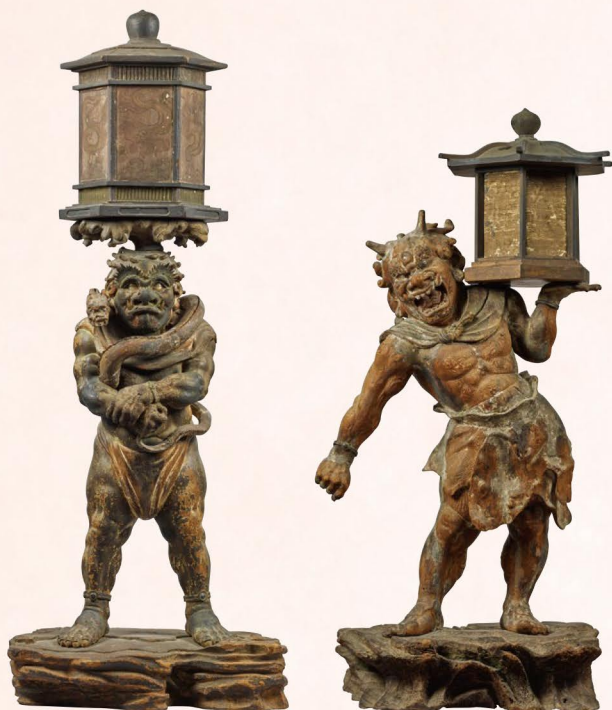
鎌倉時代・建保3年(1215) 奈良・興福寺 展示期間:4月19日~5月18日