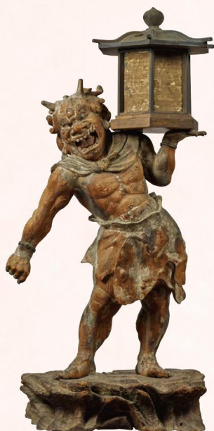
鎌倉時代・建保3年(1215) 奈良・興福寺 展示期間:4月19日~5月18日