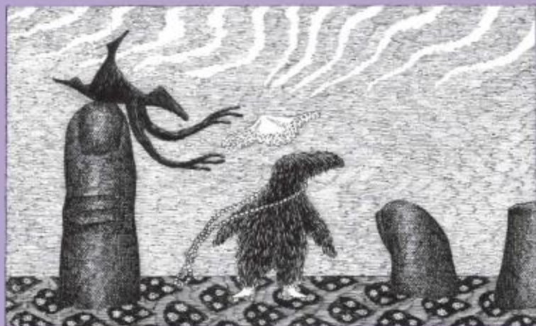
『自選集 2014』、フットボール靴の挿絵・原画1999年