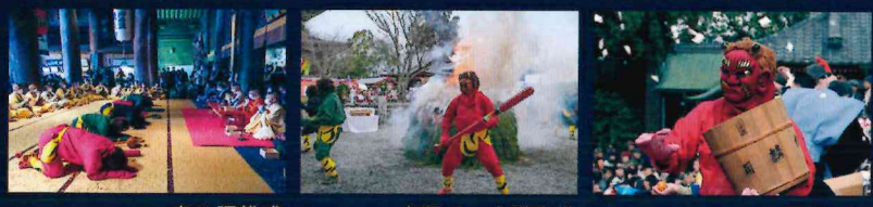
鬼の調伏式 鬼踊り 大護摩供 福豆まき