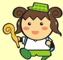
御杖村の「つえみちゃん」

キャンプはもちろんフィールドアスレチックや、アマゴ釣り、川の滑り台など様々な楽しめます。