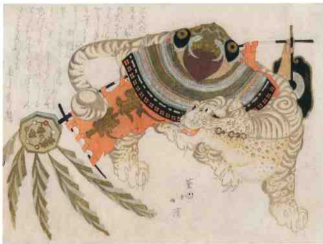
葵岡北溪「虎退治」前期展示