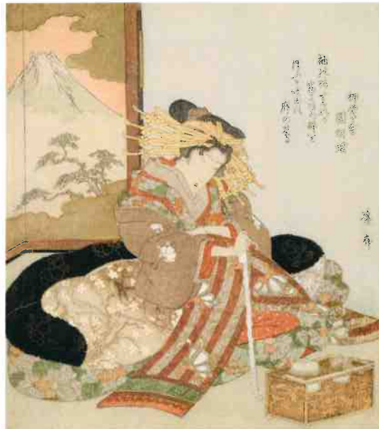
淡斎英泉「花魁」後期展示