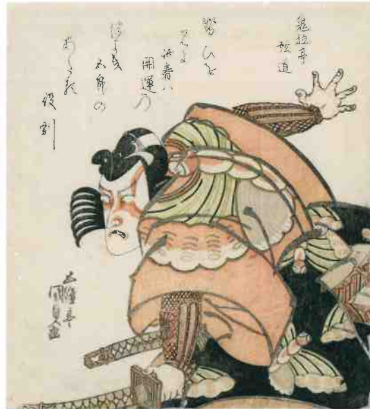
歌川国貞「七代目市川團十郎の曾我五郎」後期展示

あべのハルカス美術館では同時期(7月6日~9月1日)にあべのハルカス美術館開館10周年記念「 広重 一摺の極一 」を開催します。 本展覧会の入館券(半券可)提示で「 広重 一摺の極一 」の当日券を200円引きでご購入いただけます。また、「 広重 一摺の極一 」の観覧券(半券可)提示で、本展覧会の入館券を団体料金(2割引)でご購入いただけます。 (1枚につきお一人様1回限り有効、ほかの割引との併用不可)