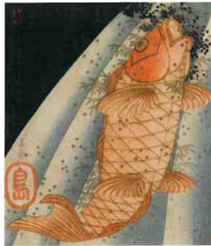
岳亭春信「上毛水魚連 真鯉・緋鯉」前期展示