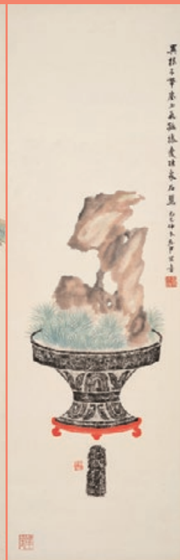
よく見ると、花器は青銅器の拓本！格調高き「花博古図」。