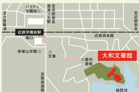
近鉄・奈良線(学園前駅)下車、南出口より徒歩約7分、無料駐車場あり