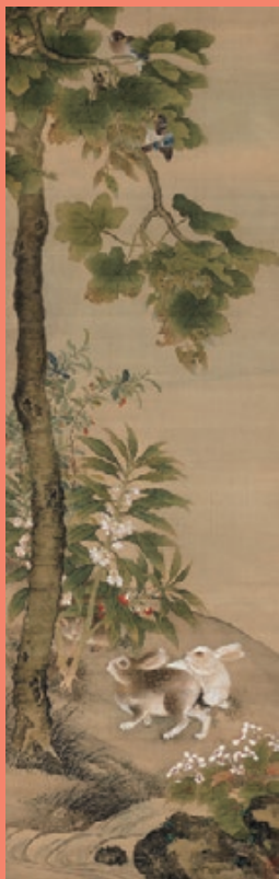
桐下遊英図 伝余松筆 中国・清時代(18世紀) 大和文華館蔵