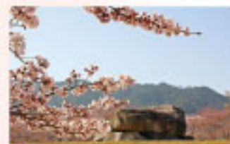
桜 3月下旬～4月上旬 村内各所が桜色に染まる、散策にもってこいの季節。本マップを片手にぜひ巡ってみてください。

◆ご注意◆ ・ゴミは持ち帰ってください。 ・花は観賞用です。 ・おやみに御座いますか？ ・路上駐車は禁止です。