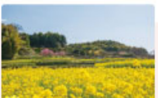
菜の花 3月～4月上旬 菜の花の黄色は気持が高まります。甘樫丘山麓、水落道路付近、鳥庄、稲淵など。