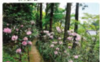
シャクナゲ 4月下旬 園寺の境内に約3千株のシャクナゲが咲き誇ります。奥の院にかけて花のトンネルのような道が続きます。