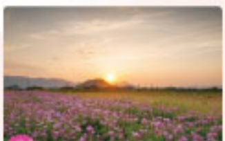
レンゲ 4月中旬～5月上旬 春のイメージといえばレンゲの花畑。御島宮跡通りから御島寺周辺、石神遺跡周辺など。

同時開催 談山神社ライトアップ 3月29日(土)～4月13日(日) 17:00～21:00 (最終受付 20:30)