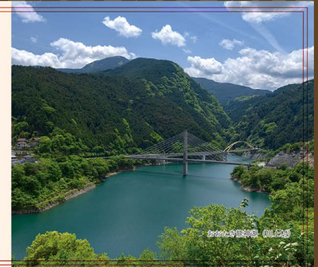
奈良県自然環境 川上町