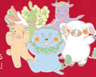
展覧会をナビゲートする 奈良国立博物館公式キャラクターの「さんまいず」

この展覧会では、日本の神さまの美術にまつわる、いろいろな「フシギ」をご紹介します。人びとが日本の神さまをどのように見つめていたのか、その秘密に迫ります。