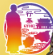
写真：行基尊像法像（唐澤興寺存蔵）