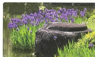
カキツバタ(5月中旬)