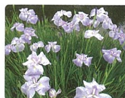
ハナショウブ(6月上旬)