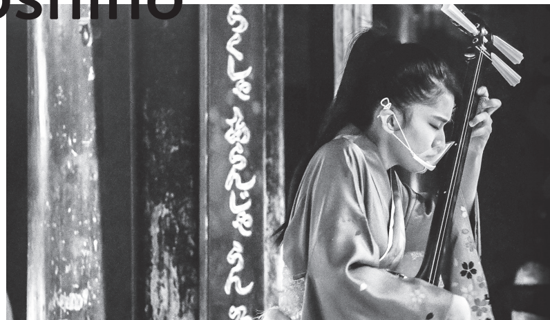
MIND TRAIL 奥大和 心のなかの美術館 MIND TRAIL OKUYAMATO - Museum in your mind