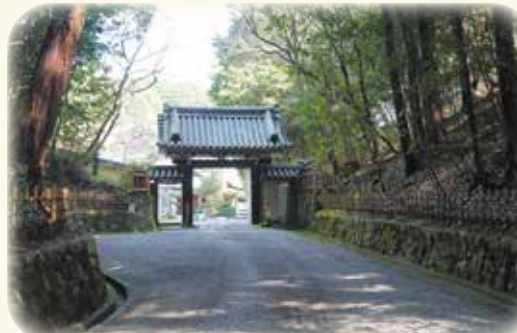
大和三門跡のひとつ 圓照寺 拝観はできませんが、山門までの参道は趣があります