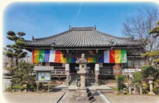
日本最古の安産祈願所 帯解寺