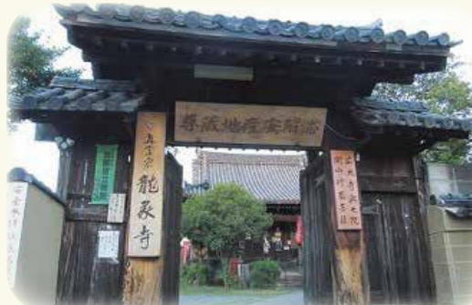
広大寺の龍の伝説が残る、「安産の寺」龍象寺