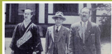
写真左：高田好胤【薬師寺元管主】 写真中央：神谷正太郎 【トヨタ自動車販売 初代社長】 写真右：菊池武三郎【奈良トヨタ 創業者】