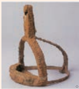
東大寺山古墳群の馬具(奈良県立橿原考古学研究所附属博物館蔵)