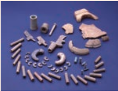
赤土山古墳の石製品(天理市教育委員会蔵)