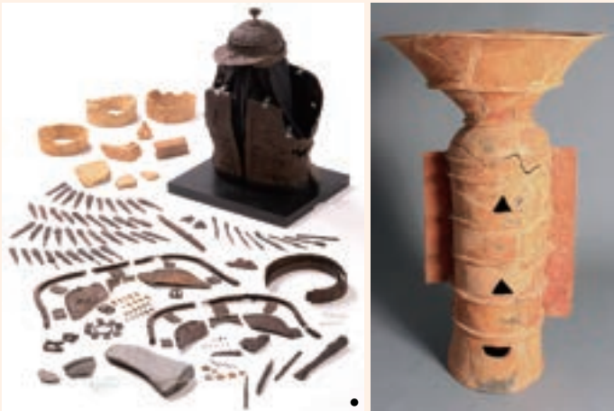
ベンシヨ塚古墳の遺物(奈良市教育委員会蔵)

ベンシヨ塚古墳 柴屋丸山古墳 帯解孤塚古墳 中之庄上ノ山古墳群 帯解黄金塚古墳 など