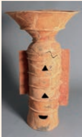
赤土山古墳の埴輪(天理市教育委員会蔵)